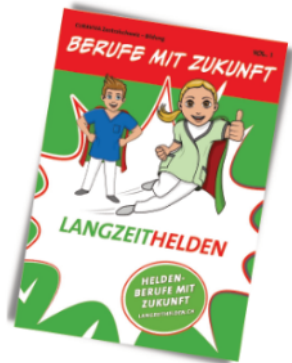
Flyer Langzeithelden, Flyer pro Beruf