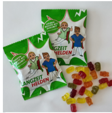
Gummibärli bio & vegan