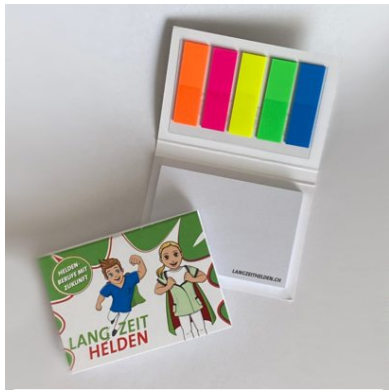
Post-it mit Markern