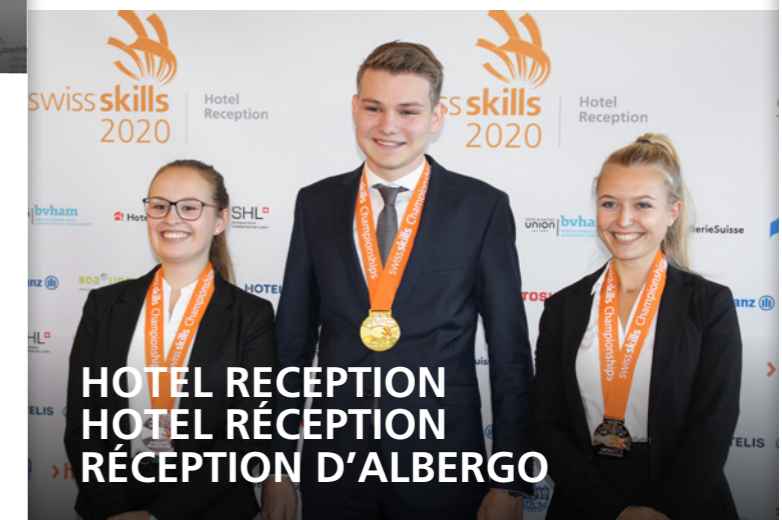
HOTEL RECEPTION HOTEL RÉCEPTION RÉCEPTION D'ALBERGO