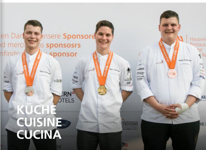
KÜCHE CUISINE CUCINA